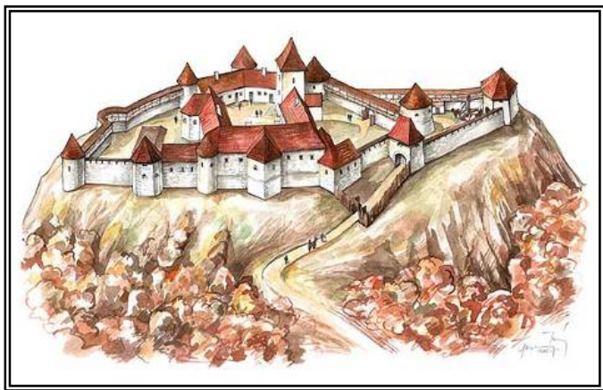
Szádvár rekonstrukciós rajza készítette: Ferenc Tamás 1

Településünk első okleveles említése 1283 – ból való egy birtokadományozás kapcsán, mikor IV. László király Vid fia Zsengének adományozott birtokhatároknál említi többek között Ardo nevét. 2 A Hidvégardói Krónika 2008. évi szeptemberi számában 3 a középkori oklevelekbe nyerhettünk betekintést melyek településünket is megemlítették mint a szádvári uradalom tartozékát. Nézzünk most néhány újabb forrást és adatot a 16., 17., 18. századból!