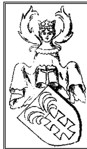
A BEBEK - család címere