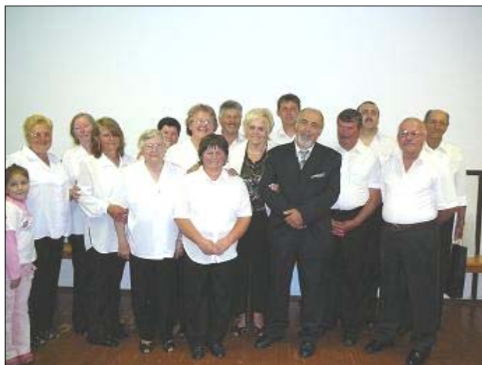
Ardói Pacsirták Népdalkör