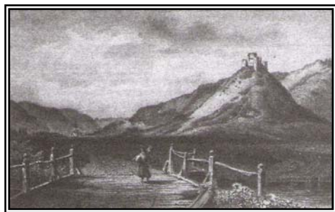
Torna vára /L. Rohbock metszete 19.sz./